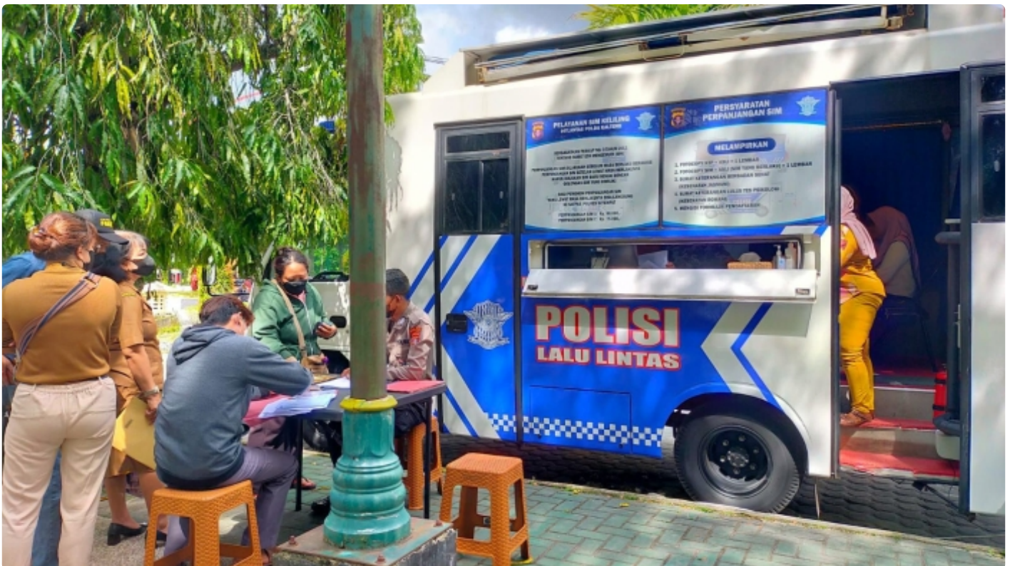
Bus Keliling Dirlantas Polda Kalteng

PALANGKA RAYA - Direktorat Lalu Lintas (Ditlantas) Polda Kalteng berikan pelayanan Surat Ijin Mengemudi (SIM) keliling bagi masyarakat Kota Palangka Raya. Selasa (6/12/2022) Pagi.